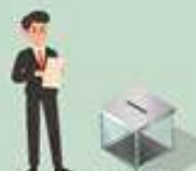
Голови відловідної виборчої комісії